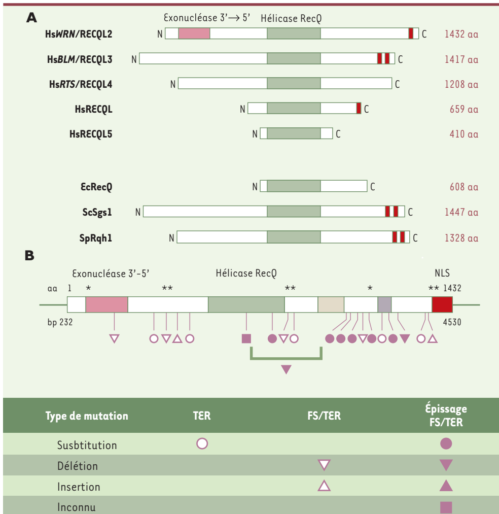
Figure 1. La protéine WRN et les autres membres de la famille des hélicases RecQ. A. WRN est l'unique hélicase RecQ à posséder un domaine exonuclease 3'→5' à l'extrémité amino-terminale (en rose sur la figure) outre le domaine conservé hélicase RecQ 3'→5' (en vert sur la figure) [14]. Outre WRN (RECQL2), il existe 4 autres hélicases de cette famille chez l'homme, dont deux (BLM et RTS) sont associées à des pathologies humaines. Des membres de cette famille existent aussi chez E.coli (EcRecQ) et chez la levure (ScSgs1 et SpRqh1). B. Mutations de WRN chez les patients atteints du syndrome de Werner. Les mutations peuvent être des substitutions conduisant à la création d'un codon stop (TER), des insertions ou des délétions avec décalage du cadre de lecture et arrêt prématuré (FS/TER), ou des mutations d'épissage. Toutes conduisent à une protéine tronquée avec la perte du signal de localisation nucléaire situé à l'extrémité carboxy-terminale. Les cellules de ces patients expriment peu ou pas de protéine WRN [10-12]. Les astérisques (*) représentent les points de polymorphismes. La base de donnée internationale HUGO rassemblant les mutations de WRN et les polymorphismes peut être consultée sur : http://www.pathology.washington.edu/werner/ws_wrn.html

L'analyse des deux substrats utilisés, qui diffèrent par leur exigence de croissance cellulaire pour révéler les événements de recombinaison, nous a permis de préciser à quelle étape du processus de recombinaison homologue WRN intervient. Cette étape semble se situer à la fin du processus, lorsque les molécules filles recombinantes nouvellement produites sont résolues et ségréguées (Figure 2). La description récente de la sensibilité accrue des lignées Werner aux agents intercalants comme le cis -platine ou la mitomycine C est cohérente avec l'hypothèse d'un rôle de WRN dans le mécanisme de recombinaison. En effet, d'autres mutants de recombinaison ou de résolution chez les bactéries, levures ou mammifères sont sensibles à un spectre similaire d'agents [16, 17].